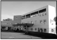
Collège LES CAPUCINS