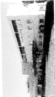
Collège LES CAPUCINS